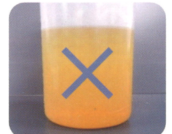
適正に管理されていない場合