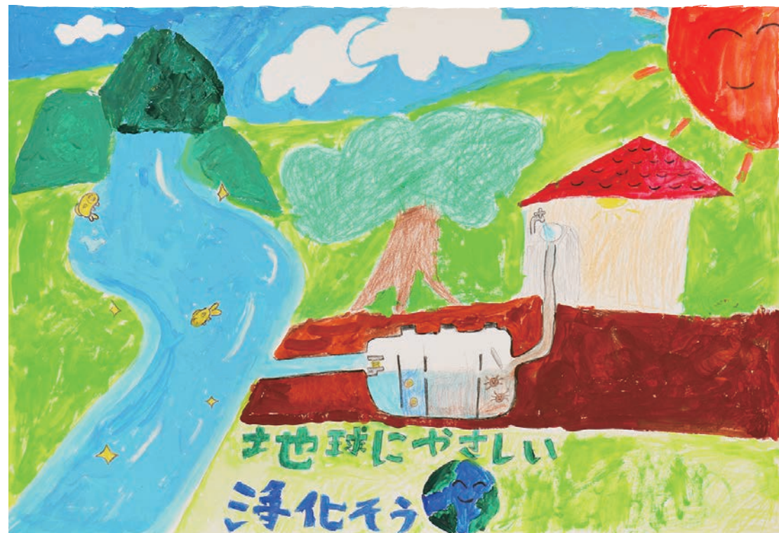
令和6年度ポスターコンクール福岡県浄化槽推進協議会会長賞