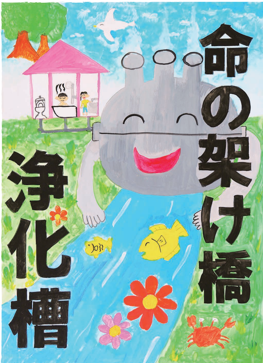
令和6年度ポスターコンクール福岡県知事賞